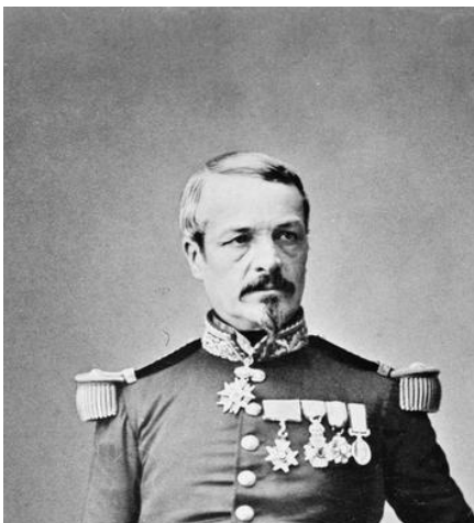
Le général Frossard lors de la guerre de Crimée (Imperial War Museum)