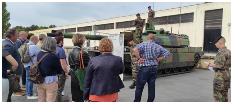
Accueil des participants et présentation du régiment et de son matériel